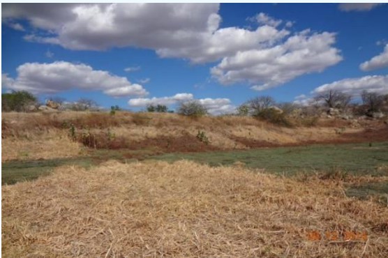
Barragem Furna da Onça – Caicó/RN Capacidade: 706.130m 3 h: 6,15 DPA: Alto