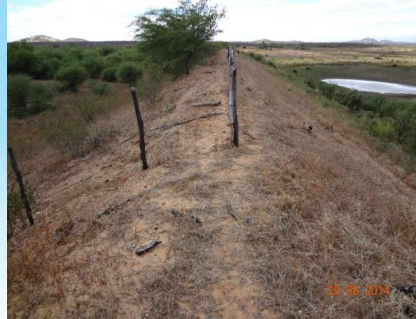
Barragem Bom Jesus – Santana do Matos/RN Capacidade: 584.363m 3 h: 8,00 DPA: Alto